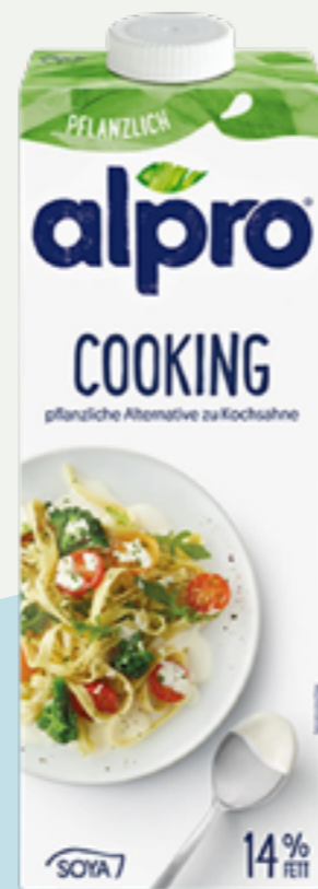
99 | ALPRO Cooking Soja-Kochcreme, 1l Art.-Nr.: A006315 VPE: 12 Stück