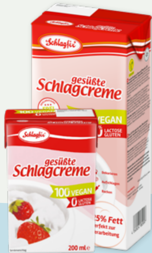
98 | SCHLAGFIX Gesüßte Schlagcreme im Tetrapack, 200 ml & 1000ml Art.-Nr.: A003572 & A003295 VPE: 18 Stück & VPE: 12 Stück

Die pflanzliche, ungesüßte Alternative zu Sahne ist vielseitig verwendbar für deftige und süße Speisen. Perfekt abgestimmt auf gastronomische Bedürfnisse: leicht aufschlagbar, gefrierstabil, im Groß- und Kleinformat. Cremiger Genuß für Ihre Gäste!