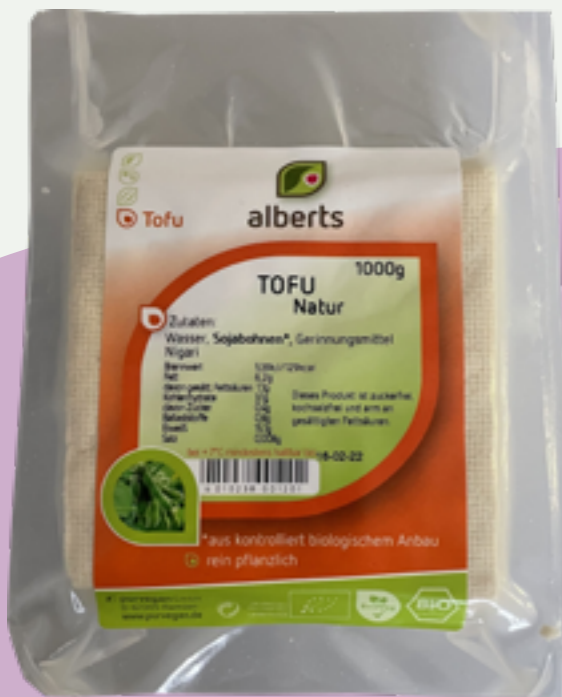
39 | ALBERTS Tofu Natur, Bio, 1kg Art.-Nr.: A004275 VPE: 2 Stück