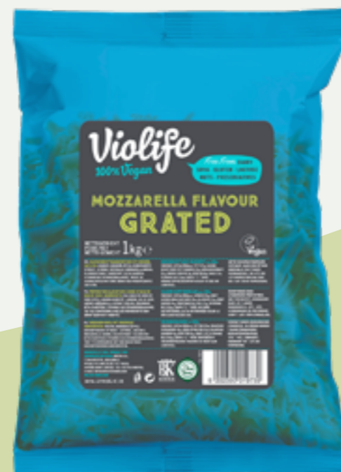
77 | VIOLIFE Mozzarella Geschmack gerieben, 1kg Art.-Nr.: A008776 VPE: 5 Stück