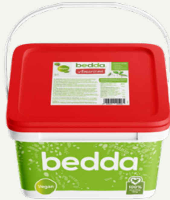
113 | BEDDA Veganes American Dressing, 3kg Art.-Nr.: A009086