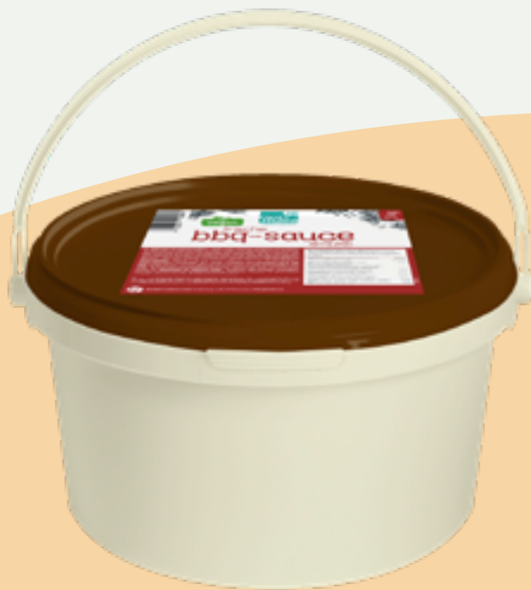
104 | OPTIMAHL CLEANLINE BBQ-Sauce Smoke, 3kg Art.-Nr.: A008809