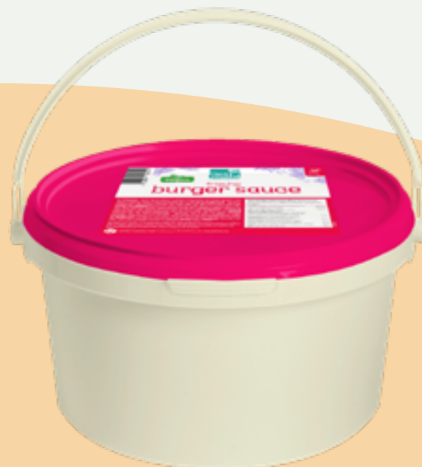
105 | OPTIMAHL CLEANLINE Burger Sauce, 3kg Art.-Nr.: A008808