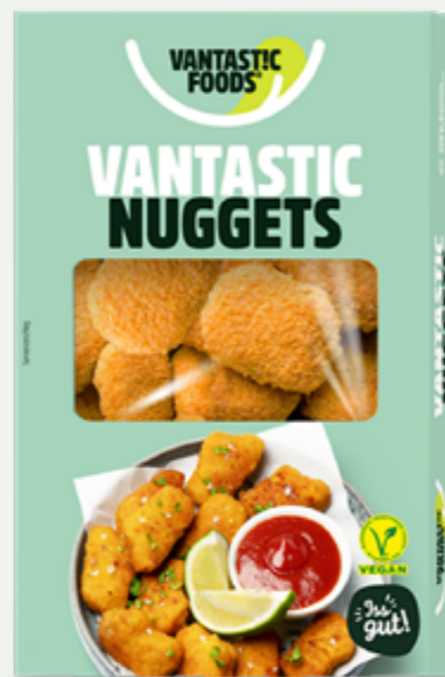
12 | VANTASTIC FOODS Vegane Nuggets, 200g Art.-Nr.: A007616 VPE: 6 Stück