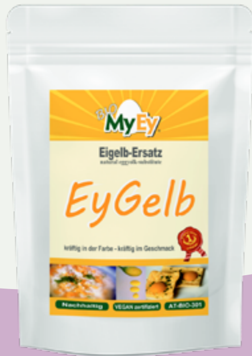
125 | MYEY Eygelb, Bio, 1kg Art.-Nr.: A000352 VPE: 6 Stück