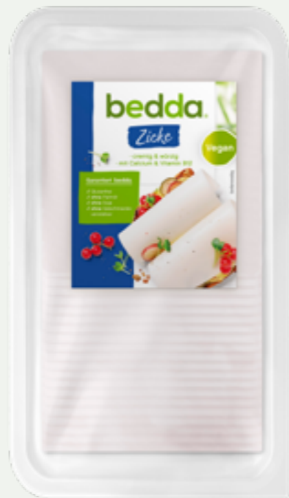
84 | BEDDA Scheiben Zicke, 500g Art.-Nr.: A009092 VPE: 12 Stück