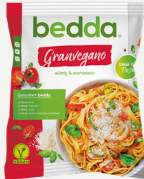
75 | BEDDA Granvegano, 100g Art.-Nr.: A006447 VPE: 6 Stück