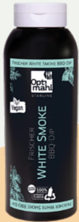
111 | OPTIMAHL STARLINE White Smoked BBQ Dip, 850g Art.-Nr.: A008812 VPE: 6 Stück