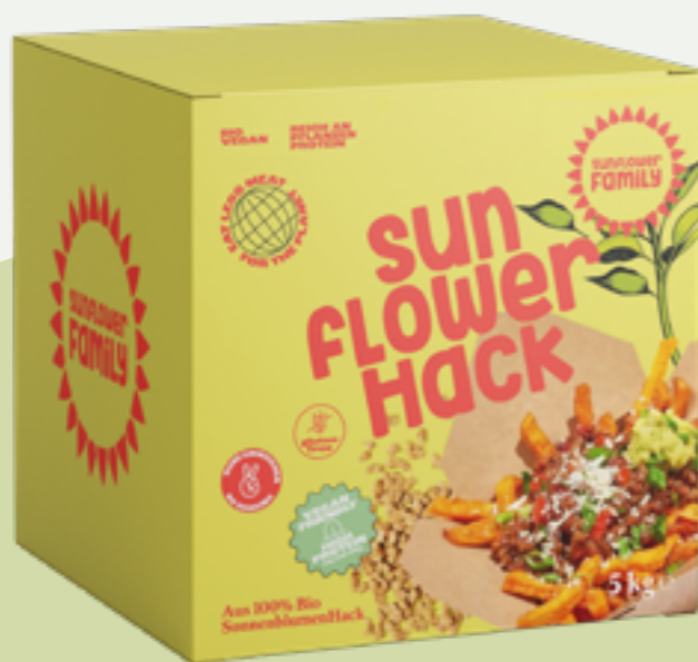
18 | SUNFLOWERFAMILY Sonnenblumen Hack (Gastropackung), Bio, 5kg Art.-Nr.: A006505