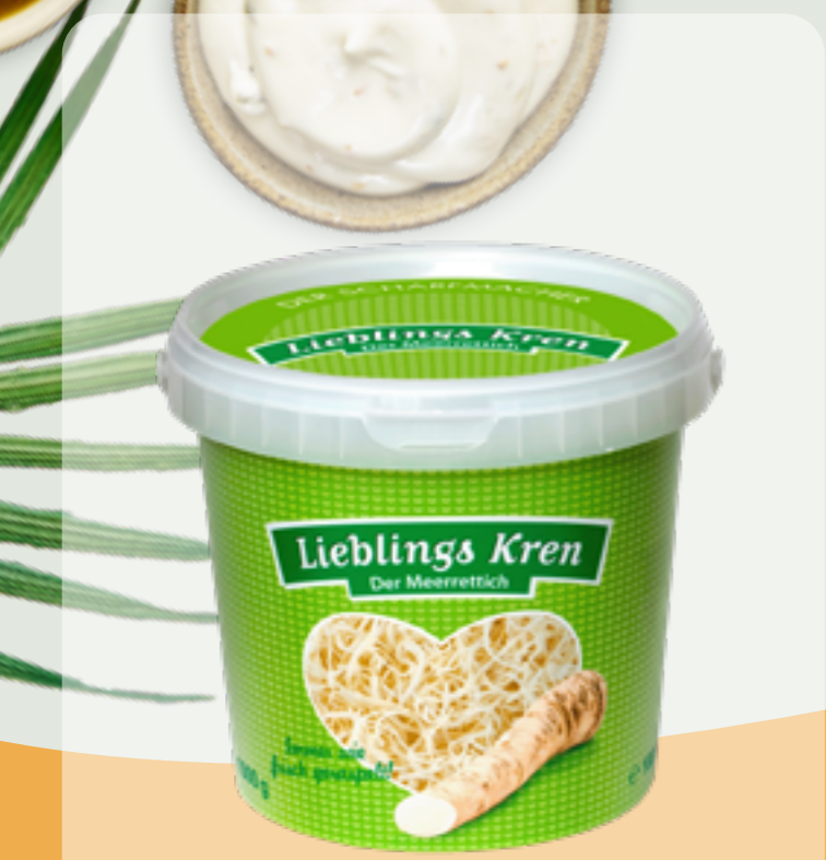
110 | LIEBLINGSKREN Der Meerrettich, 1kg Art.-Nr.: A009039 VPE: 6 Stück

WE LOVE VAYONNAISE Sie schmeckt nicht nur leicht und würzig, sondern verleiht Kartoffelsalat, Nudelsalat oder Sandwiches den finalen Pfiff. Auch herzhaftere Saucen und fantastisch cremige Dips für Snacks und Fastfood gelingen mit der Vayonaise im Handumdrehen und machen sie somit zu einer unverzichtbaren, vielfältig einsetzbaren Zutat für allerlei Speisen.