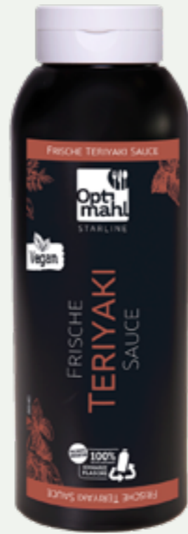
103 | OPTIMAHL STARLINE Teriyaki Sauce, 850g Art.-Nr.: A008814 VPE: 6 Stück