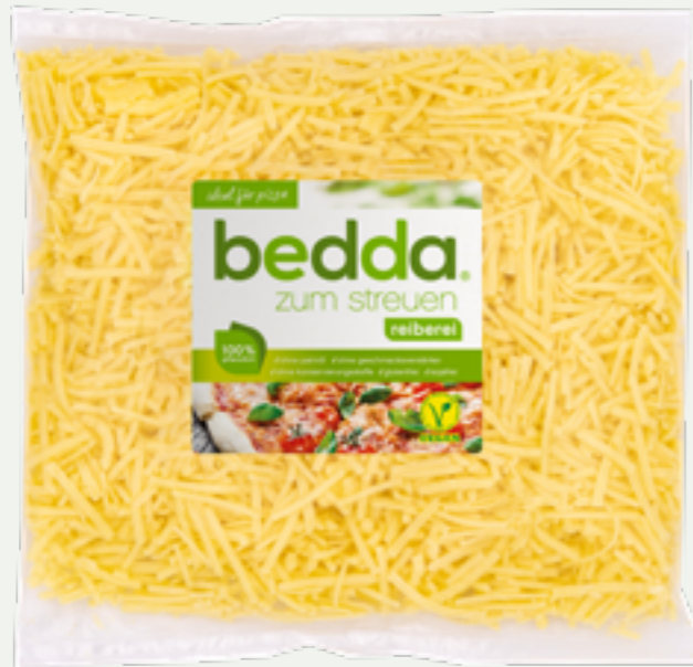
74 | BEDDA Reiberei, 1000g Art.-Nr.: A005985 VPE: 7 Stück