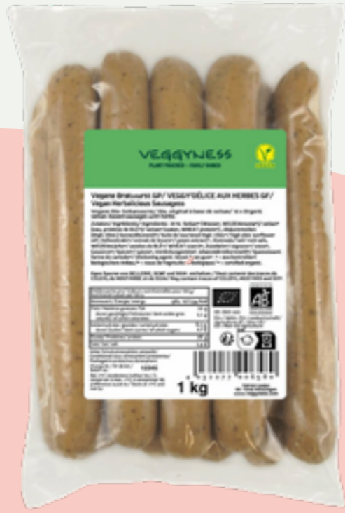
23 | VEGGYNESS Vegane BRATWURST, Bio, 1kg Art.-Nr.: A005170 VPE: 20 Stück