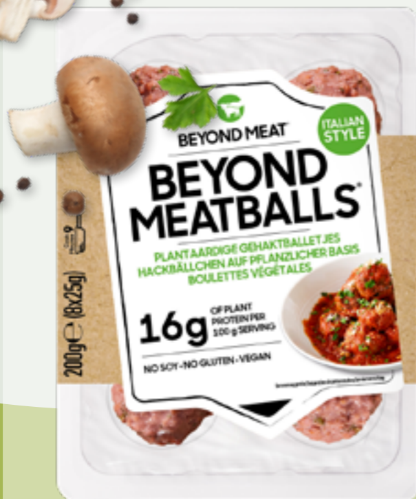
8 | BEYOND MEAT Beyond Meatballs, 200g Art.-Nr.: A007923 VPE: 8 Stück

DIE TEXTUR MACHT'S Egal ob als Alternative zu Cheese-, Royal- oder Barbecue-Burger - unser Vantastic Pattie ist aufgrund seiner (un)vewechselbaren, fleischi- gen Textur die ideale Basis für den allseits be- liebten Fastfood-Klassiker! Die Doppelpackung eignet sich hervorragend bei gelegentlicher Nachfrage nach einer pflanzlichen Alternative.