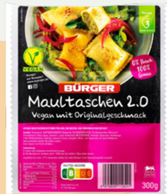
64 | BÜRGER Vegane Maultaschen 2.0, 300g Art.-Nr.: A008318 VPE: 8 Stück