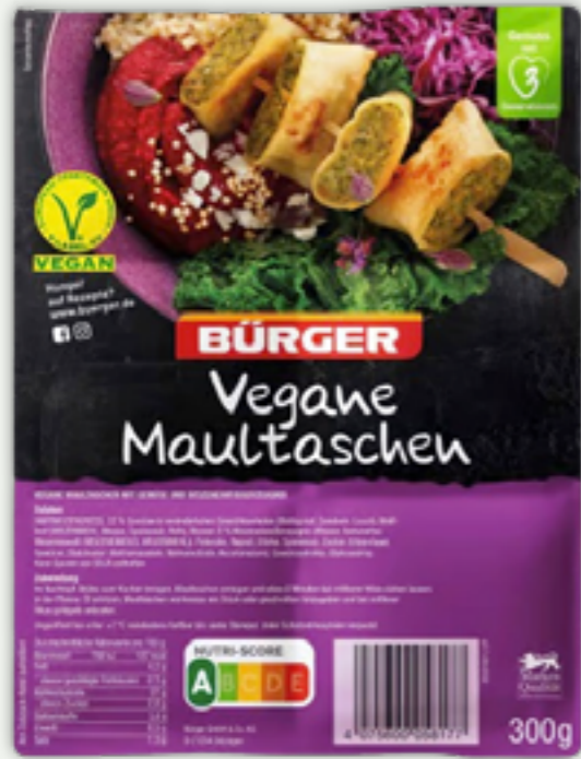
62 | BÜRGER Vegane Maultaschen, 300g Art.-Nr.: A008319 VPE: 8 Stück