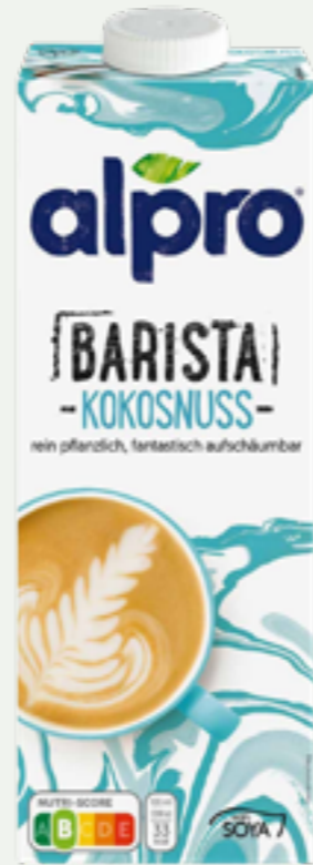
92 | ALPRO Barista Kokosnuss, 1l Art.-Nr.: A007735 VPE: 12 Stück

✓ AUFSCHÄUMBAR ✓ FÜR PROFESSIONELLE VERWENDUNG ✓ AUCH PUR EIN FRISCHER GENUSS!