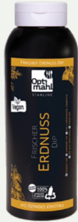
109 | OPTIMAHL STARLINE Erdnuss Dip, 850g Art.-Nr.: A008813 VPE: 6 Stück