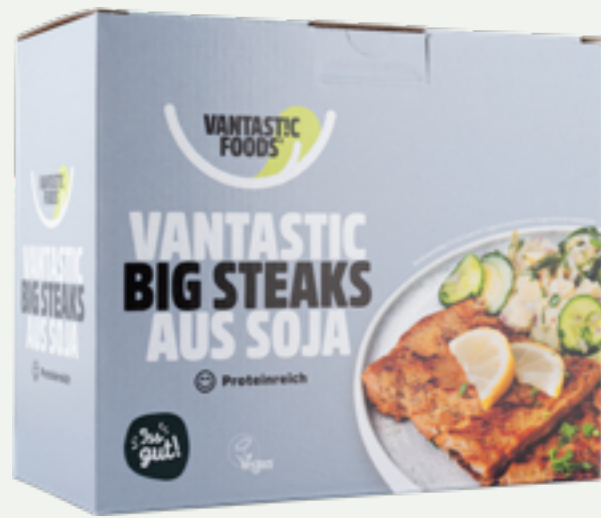
1 | VANTASTIC FOODS BIG STEAKS aus Soja, 500g Art.-Nr.: A000763 VPE: 8 Stück