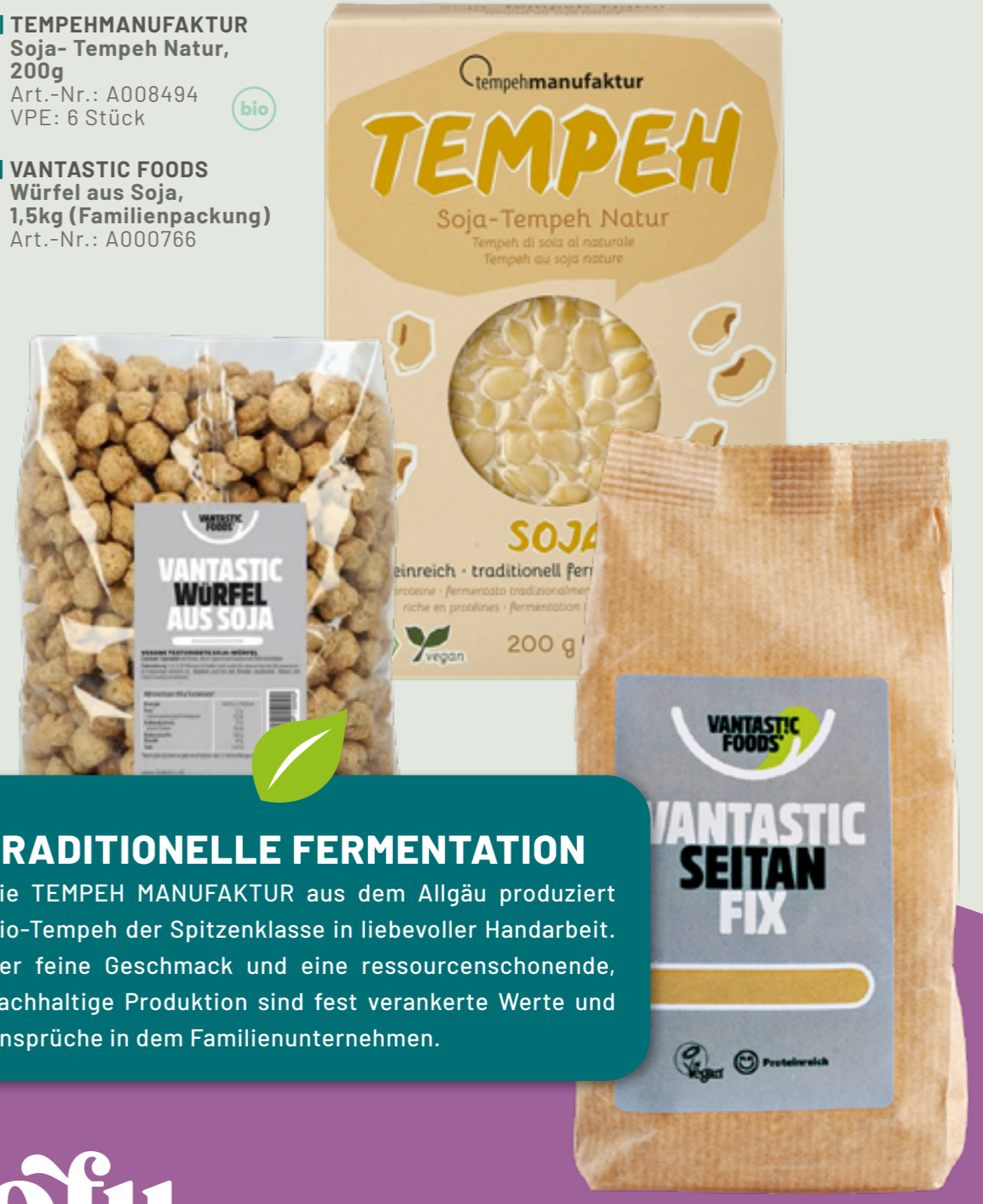
50 | VANTASTIC FOODS Wüfel aus Soja, 1,5kg (Familienpackung) Art.-Nr.: A000766

TRADITIONELLE FERMENTATION Die TEMPEH MANUFAKTUR aus dem Allgäu produziert Bio-Tempeh der Spitzenklasse in liebevoller Handarbeit. Der feine Geschmack und eine ressourcenschonende, nachhaltige Produktion sind fest verankerte Werte und Ansprüche in dem Familienunternehmen.