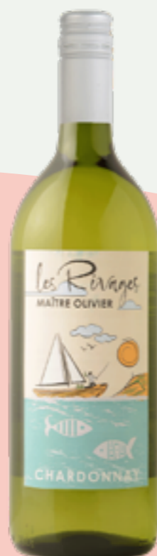
54 | CLAUDE VIALADE Les Rivages Chardonnay, 1l Art.-Nr.: A008937 VPE: 6 Stück