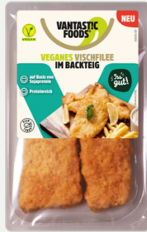
69 | VANTASTIC FOODS Veganes Vischfilee im Backteig, 200g Art.-Nr.: A008335 VPE: 6 Stück