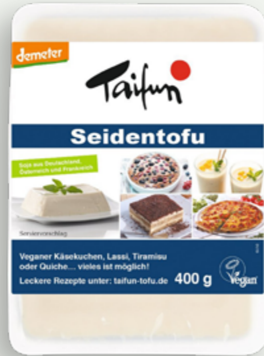
38 | TAIFUN Seidentofu, Bio, 400g Art.-Nr.: A001325 VPE: 6 Stück