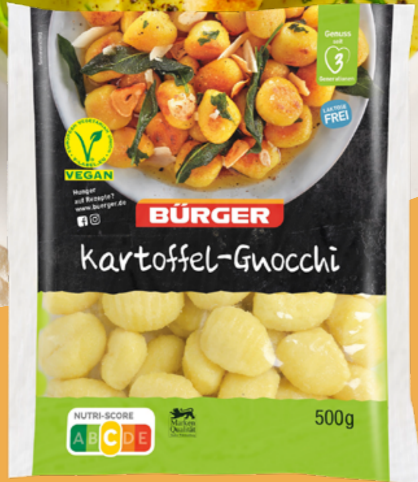
56 | BÜRGER Kartoffel-Gnocchi, 500g Art.-Nr.: A008317 VPE: 5 Stück