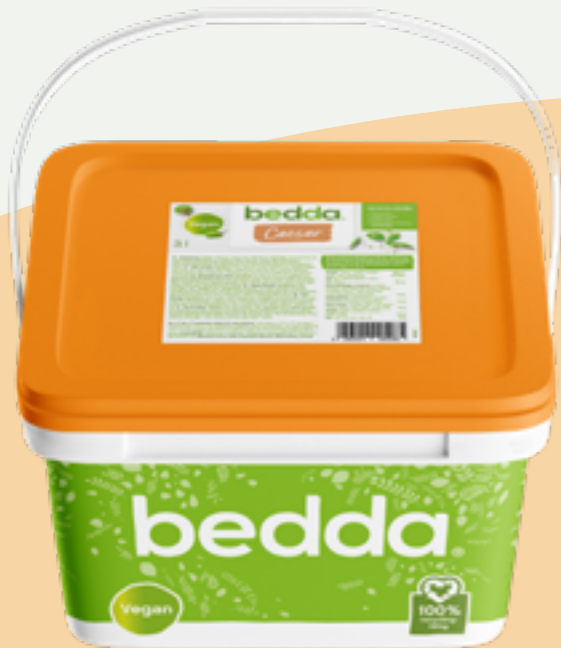
114 | BEDDA Veganes Caesar Dressing, 3kg Art.-Nr.: A009088