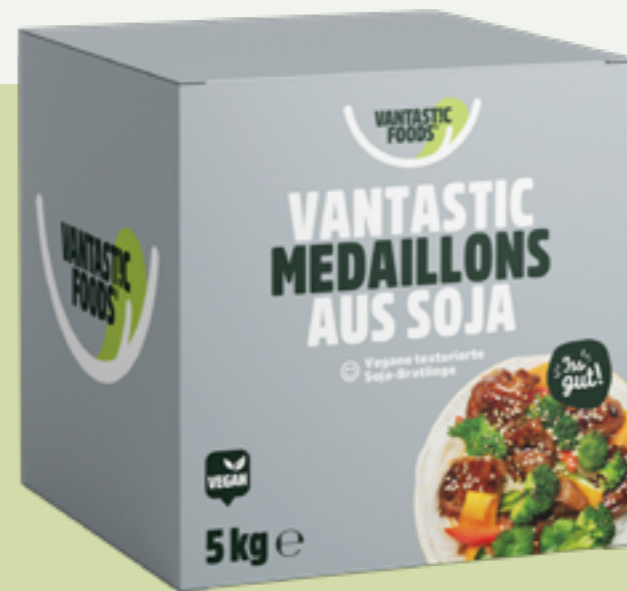
4 | VANTASTIC FOODS MEDAILLONS aus Soja, 5kg Art.-Nr.: A000783