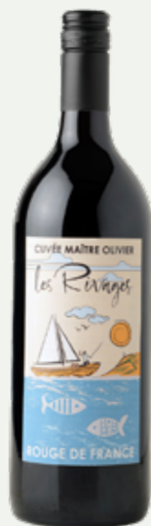
52 | CLAUDE VIALADE Les Rivages Cuvée Maître Olivier Red, 1l Art.-Nr.: A008940 VPE: 6 Stück