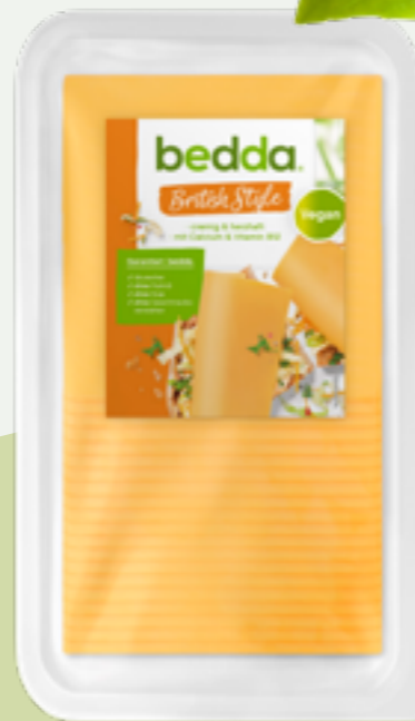
86 | BEDDA Scheiben British Style, 500g Art.-Nr.: A009090 VPE: 12 Stück