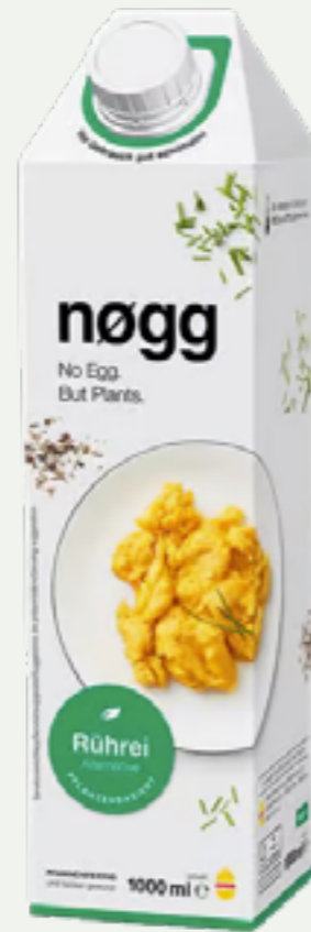
124 | NØGG Rührei-Alternative, 1l Art.-Nr.: A008947 VPE: 6 Stück