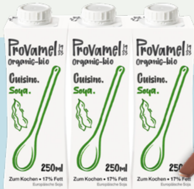
94 | PROVAMEL Soja Cuisine, Bio, 3x250ml Art.-Nr.: A005964 VPE: 5 Stück