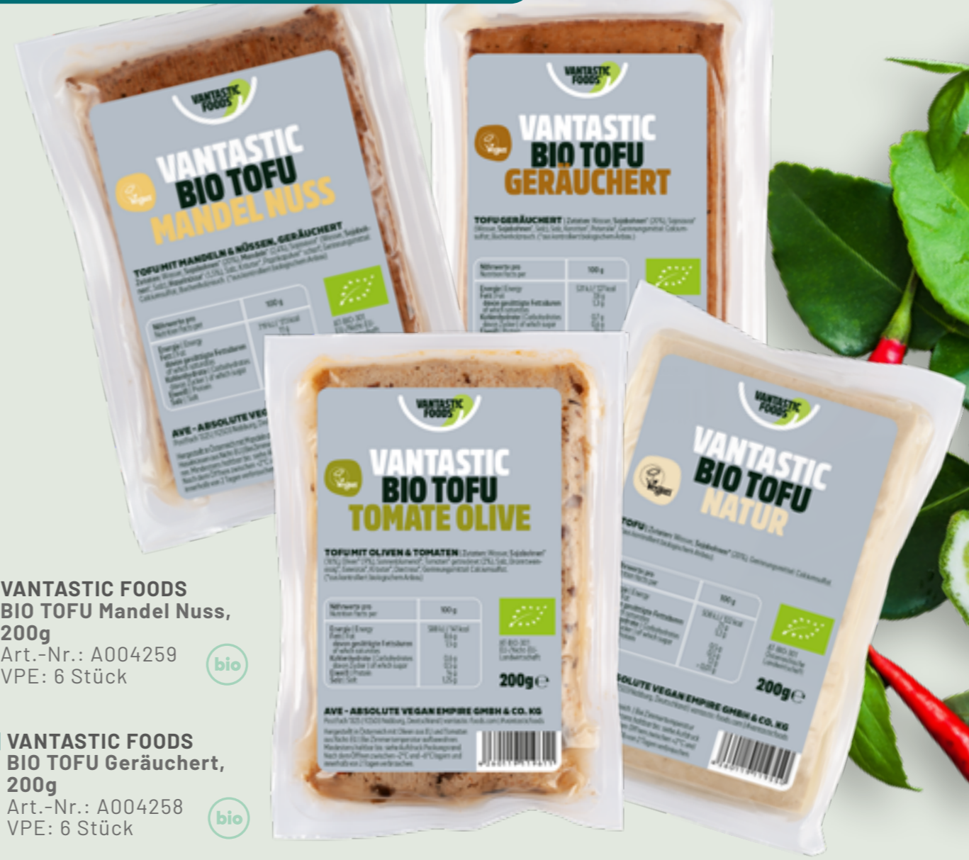
41 | VANTASTIC FOODS BIO TOFU Mandel Nuss, 200g Art.-Nr.: A004259 VPE: 6 Stück

✓ REIN PFLANZLICHER TOFUBLOCK ✓ UNGEKÜHLT LAGERBAR ✓ KÖSTLICH UND BIO