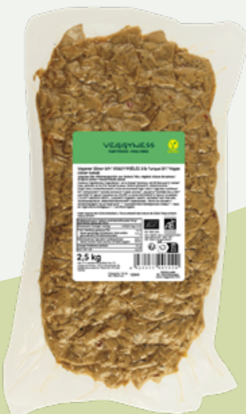
9 | VEGGYNESS Veganer Döner Großpack, BIO, 2,5kg Art.-Nr.: A007702 VPE: 8 Stück