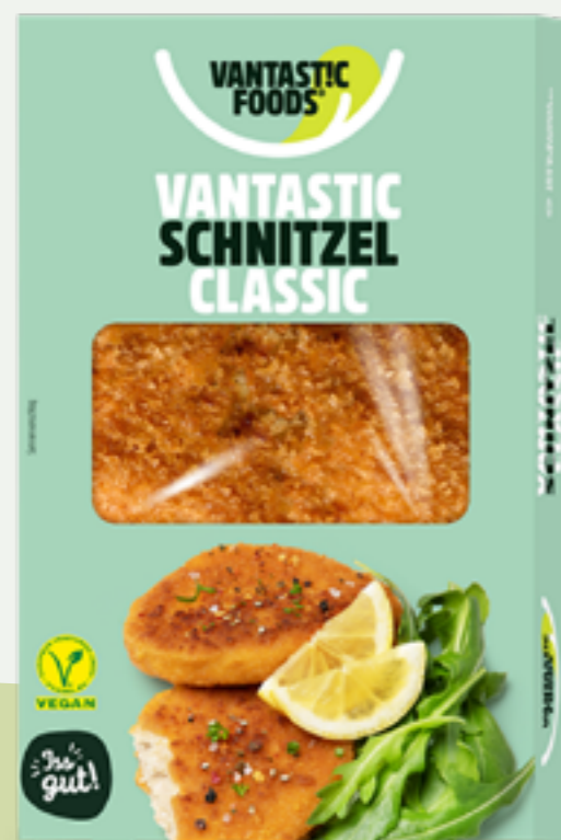
13 | VANTASTIC FOODS Veganes Schnitzel, 200g Art.-Nr.: A007617 VPE: 6 Stück