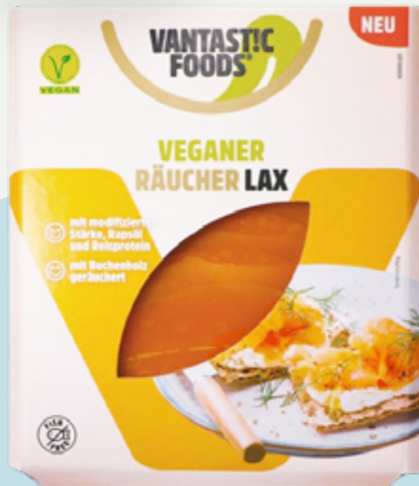
70 | VANTASTIC FOODS Vegane Räucherlax, 100g Art.-Nr.: A008568 VPE: 6 Stück