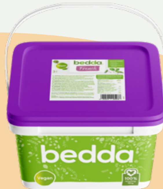
115 | BEDDA Veganes French Dressing, 3kg Art.-Nr.: A009087