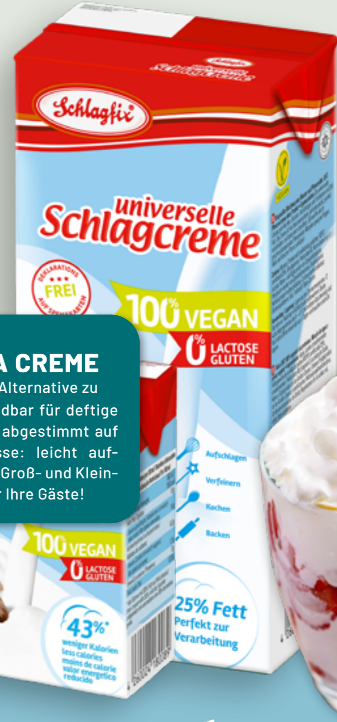
101 | SCHLAGFIX Universelle Schlagcreme im Tetrapack, 200ml Art.-Nr.: A003573 VPE: 18 Stück