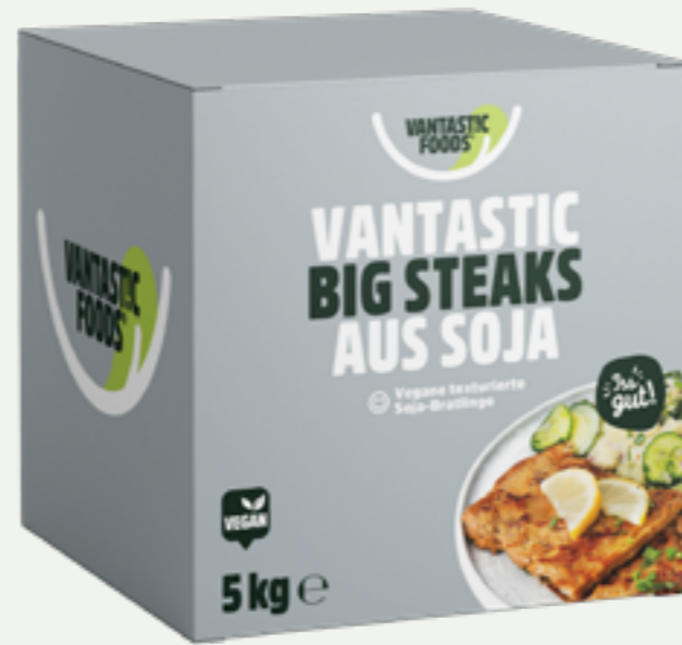
2 | VANTASTIC FOODS BIG STEAKS aus Soja, 5kg und 6kg (Vorratskarton) Art.-Nr.: Big Steak (8x13 cm) A000785 Steak (8x7 cm) A005179