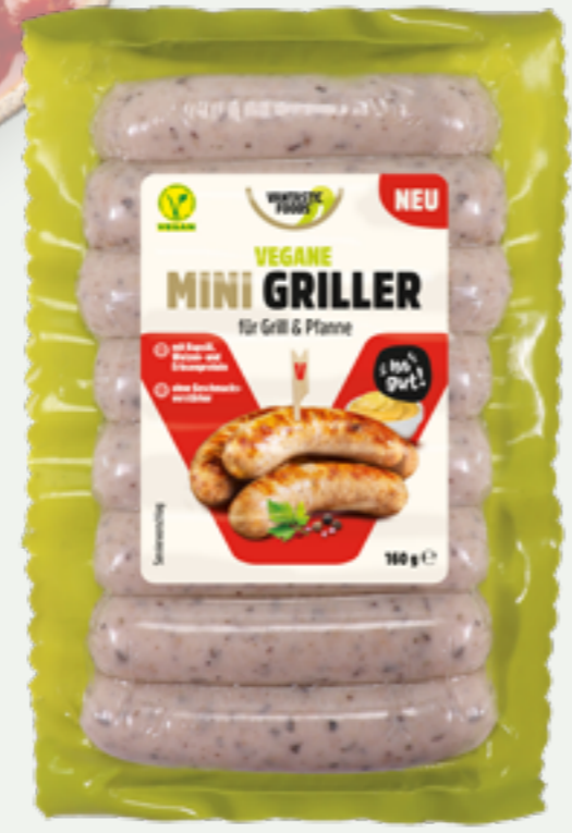
21 | VANTASTIC FOODS Mini Griller, 160g Art.-Nr.: A008008 VPE: 6 Stück