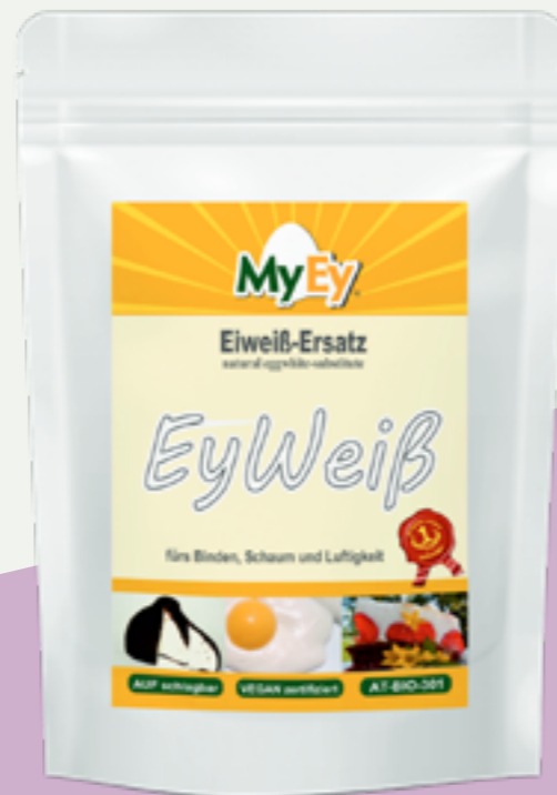
126 | MYEY Eyweiss, 1kg Art.-Nr.: A000351 VPE: 6 Stück