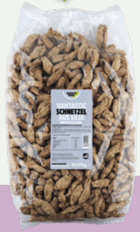
46 | VANTASTIC FOODS Schnetzel aus Soja, 1kg (Familienpackung) Art.-Nr.: A000767 VPE: 8 Stück