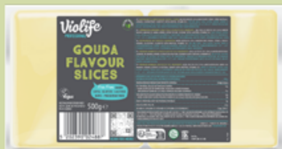
82 | VIOLIFE Scheiben Gouda Geschmack, 500g Art.-Nr.: A008775 VPE: 8 Stück