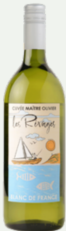
51 | CLAUDE VIALADE Les Rivages Cuvée Maître Olivier White, 1l Art.-Nr.: A008938 VPE: 6 Stück