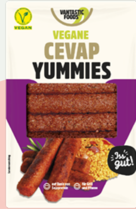
22 | VANTASTIC FOODS Vegane Cevap Yummies, 160g Art.-Nr.: A008023 VPE: 6 Stück

GRILLEN IN VEGAN Grillen ohne Fleisch ist langweilig? Ganz im Gegenteil! Mit den Grillspezialitäten von Vantastic foods wird das farbenfrohe vegane Grillmenü sogar um ein ausgesprochen schmackhaftes Stück reicher.