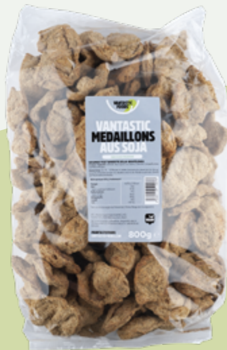
3 | VANTASTIC FOODS MEDAILLONS aus Soja, 800g (Familienpackung) Art.-Nr.: A000764 VPE: 8 Stück