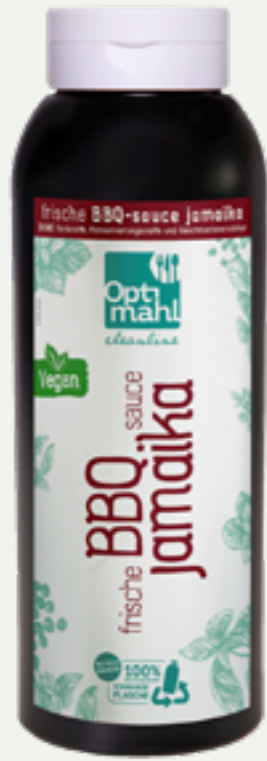
102 | OPTIMAHL CLEANLINE BBQ-Sauce Jamaika, 1kg Art.-Nr.: A008811 VPE: 6 Stück