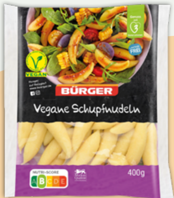
63 | BÜRGER Vegane Schupfnudeln, 400g Art.-Nr.: A008320 VPE: 5 Stück