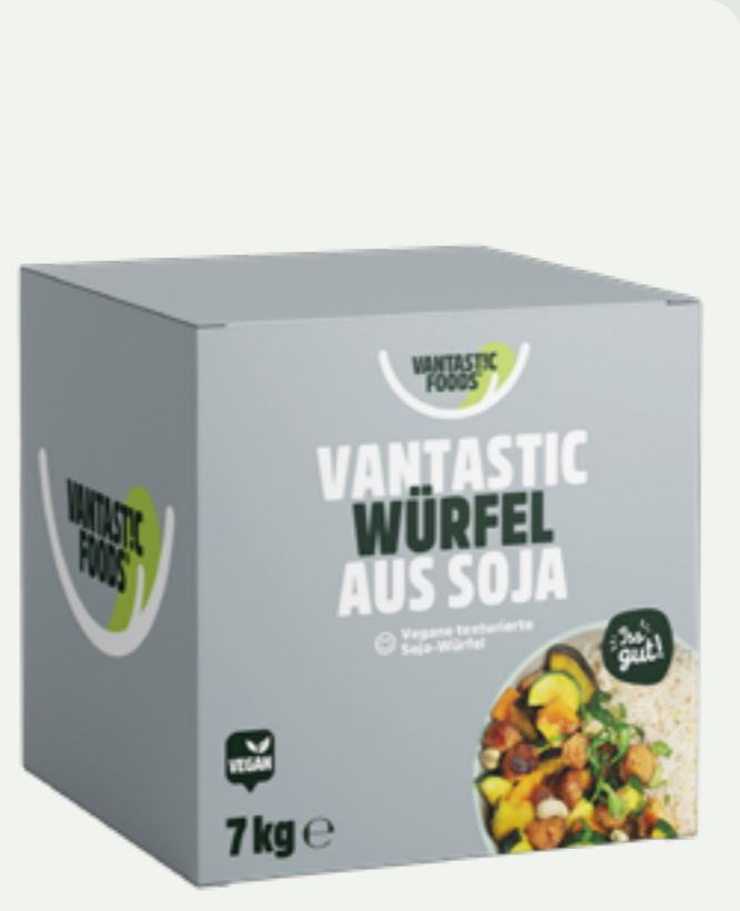
45 | VANTASTIC FOODS Wüfel aus Soja, 7kg (Vorratskarton) Art.-Nr.: A000781