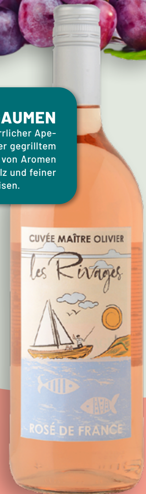
55 | CLAUDE VIALADE Les Rivages Cuvée Maître Olivier Rosé, 1l Art.-Nr.: A008939 VPE: 6 Stück

Frisch, aromatisch, mit Ausdauer im Abgang: Ein herrlicher Aperitif, genauso wie zu Vorspeisen und gebratenem oder gegrilltem Gemüse. Der frische Rosé eröffnet uns eine Vielfalt von Aromen wie Erdbeere und Johannisbeere, mit zartem Schmelz und feiner Restsüße. Passt ideal zu leichten, sommerlichen Speisen.