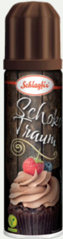
96 | SCHLAGFIX Schokotraum, 200ml Art.-Nr.: A007962 VPE: 12 Stück