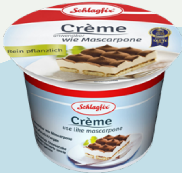
93 | SCHLAGFIX Creme anwendbar wie Mascarpone, 250g Art.-Nr.: A006935 VPE: 6 Stück