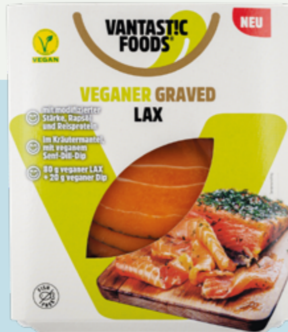
71 | VANTASTIC FOODS Vegane Graved Lax im Kräutermantel mit Senf-Dill Dip, 100g Art.-Nr.: A008569 VPE: 6 Stück