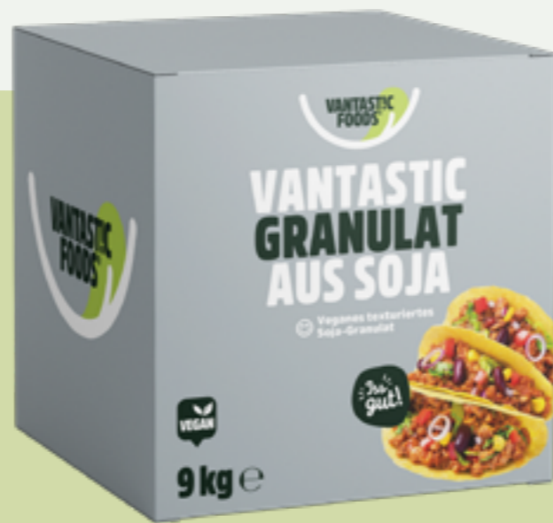
19 | VANTASTIC FOODS Granulat aus Soja, 9kg (Vorratskarton) Art.-Nr.: A000784