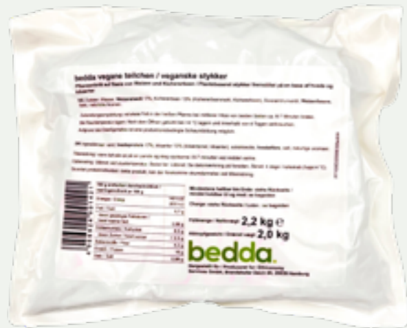
16 | BEDDA Vegane Teilchen, 2kg Art.-Nr.: A009093 VPE: 5 Stück