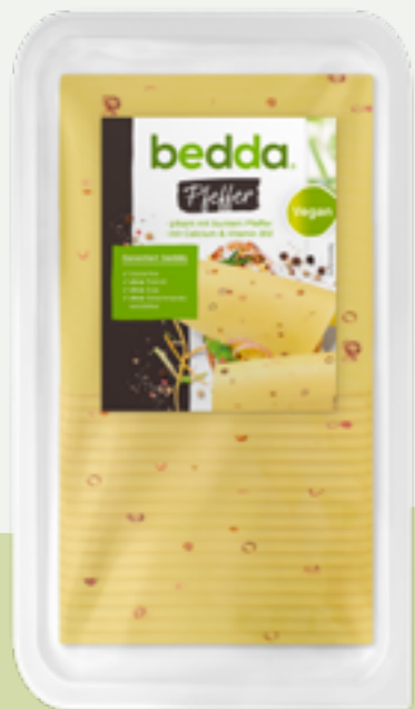
85 | BEDDA Scheiben Pfeffer, 500g Art.-Nr.: A009091 VPE: 12 Stück

Eine einfache und delikate Alternative bei speziellen Ernährungsbedürfnissen: unsere bedda Scheiben sind absolut laktose- und glutenfrei und verwendbar wie klassischer Käse-Aufschnitt. So kann wirklich jeder genießen!