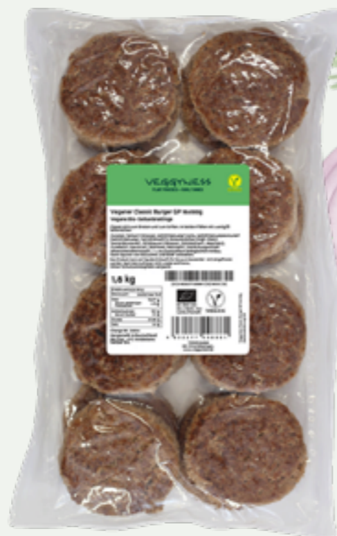
7 | VEGGYNESS VEGANER CLASSIC BURGER, BIO, 1,6kg Art.-Nr.: A008038 VPE: 12 Stück