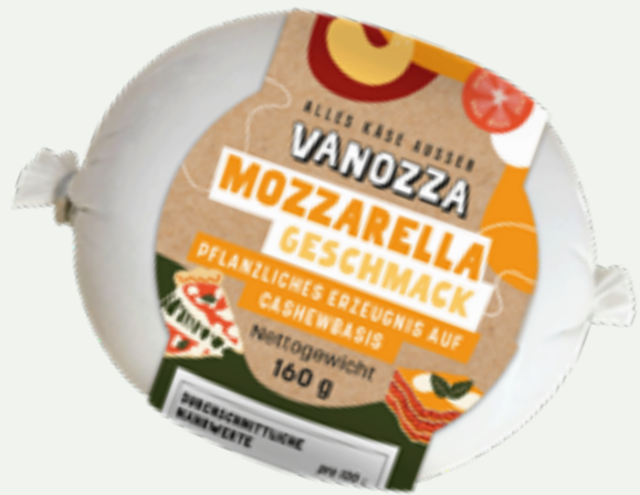
79 | VANOZZA Mozzarella Geschmack Kugel, 160g Art.-Nr.: A008841 VPE: 5 Stück