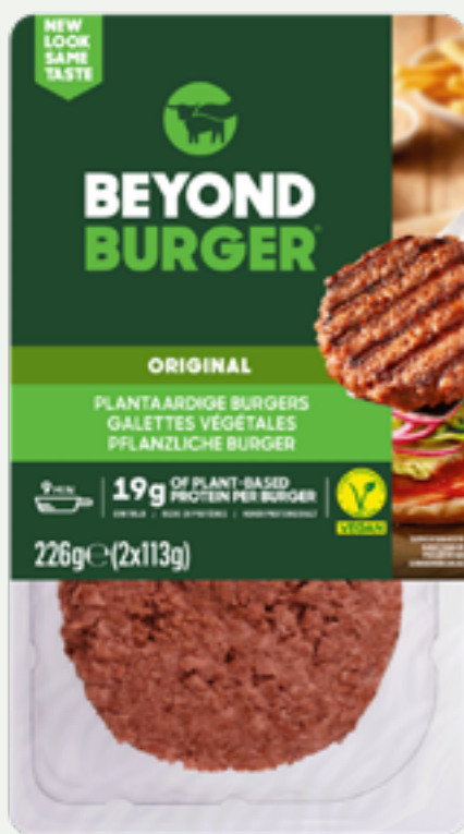
6 | BEYOND MEAT Meat Beyond Burger, 226g Art.-Nr.: A007919 VPE: 8 Stück