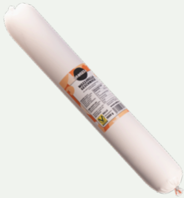
80 | VANOZZA Mozzarella Geschmack Rolle, 1kg Art.-Nr.: A008840 VPE: 5 Stück