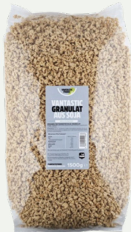
17 | VANTASTIC FOODS Granulat aus Soja, 1,5kg (Familienpackung) Art.-Nr.: A000765 VPE: 6 Stück