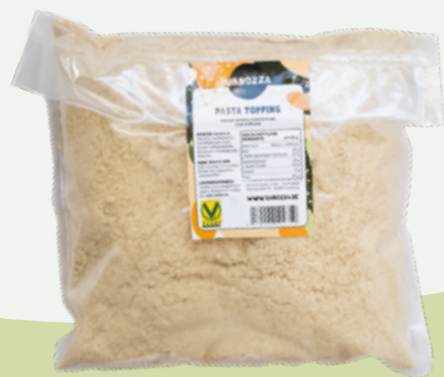
76 | VANOZZA Pasta Topping, 1kg Art.-Nr.: A008842

78 | VANTASTIC FOODS GRATTUGIATO, 60g Art.-Nr.: A007626 VPE: 6 Stück