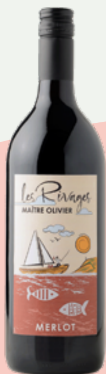
53 | CLAUDE VIALADE Les Rivages Merlot, 1l Art.-Nr.: A008941 VPE: 6 Stück