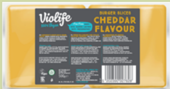
81 | VIOLIFE Scheiben Cheddar Geschmack, 500g Art.-Nr.: A008774 VPE: 8 Stück