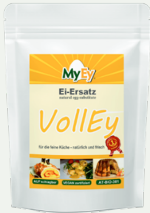
123 | MYEY VOLLEY, 1kg Art.-Nr.: A000353 VPE: 6 Stück