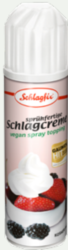
97 | SCHLAGFIX Sprühfertige Schlagcreme, 200ml Art.-Nr.: A004391 VPE: 12 Stück