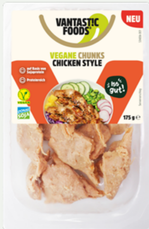
11 | VANTASTIC FOODS Vegane Chunks Chicken Style, 175g Art.-Nr.: A008336 VPE: 6 Stück