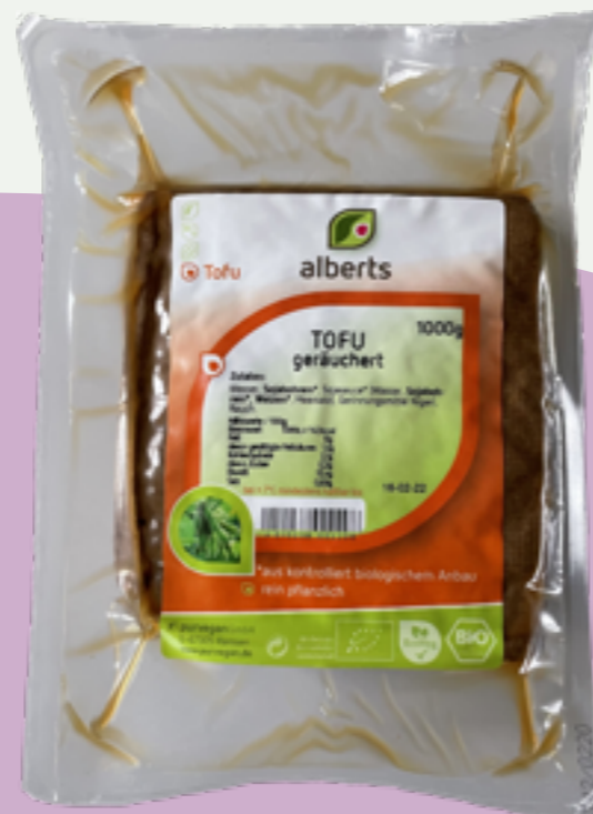
40 | ALBERTS Tofu Geräuchert, Bio, 1kg Art.-Nr.: A004277 VPE: 2 Stück