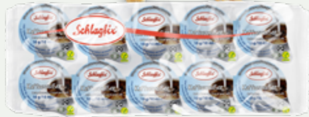
91 | SCHLAGFIX Kaffeeweisser 10% Fett Blister, Portionen 10x10ml Art.-Nr.: A006481 VPE: 20 Stück