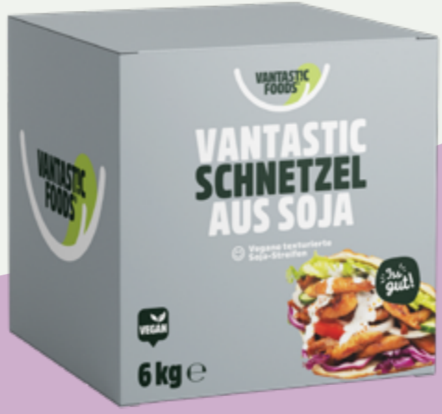
47 | VANTASTIC FOODS Schnetzel aus Soja, 6kg (Vorratskarton) Art.-Nr.: A000782