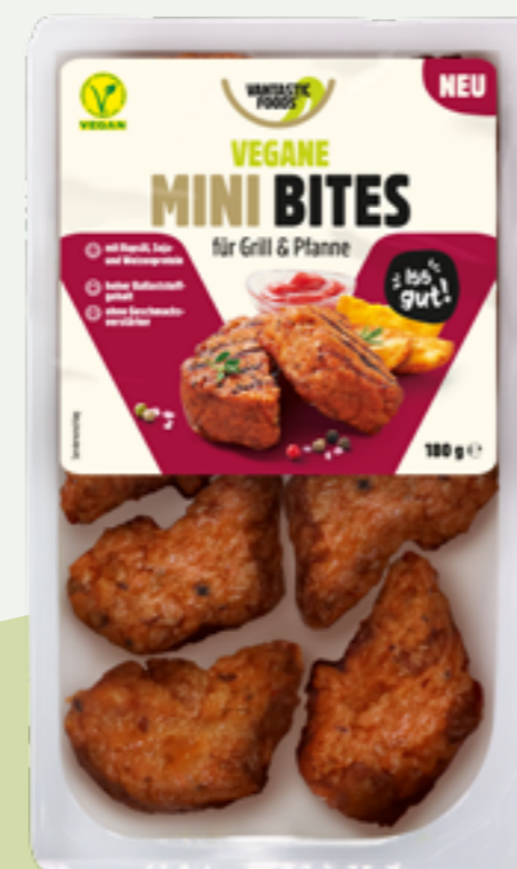
14 | VANTASTIC FOODS Vegane Mini Bites, 180g Art.-Nr.: A008009 VPE: 6 Stück